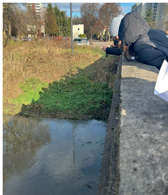
Pomiar głębokości rzeki za pomocą sznurka