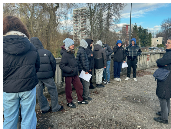
Przygotowania do pomiaru prędkości wody