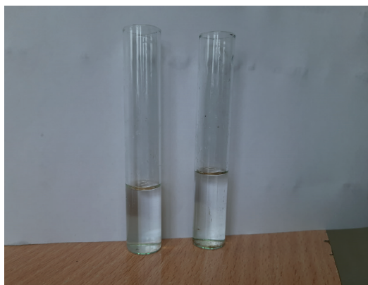
Porównanie przejrzystości wody rzecznej i kranowej