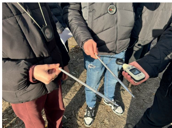
Pomiar temperatury wody i powietrza