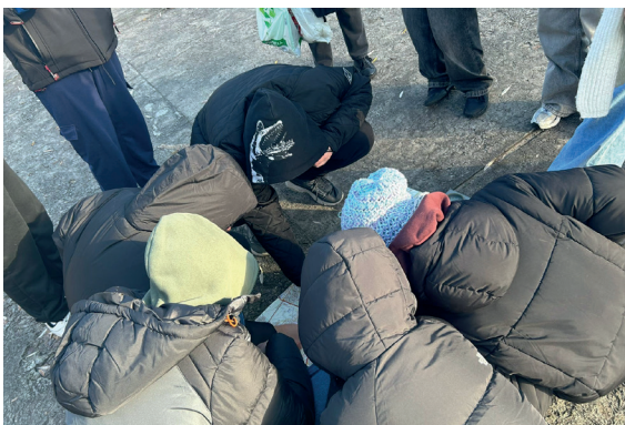
Orientowanie planu i ustalenie lokalizacji miejsca badań.