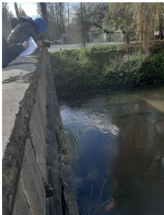
Obserwacja koryta rzeczego