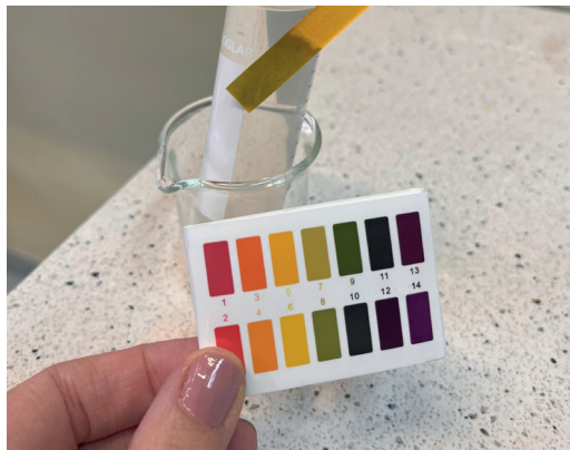
Badanie pH wody rzecznej za pomocą papierków lakmusowych